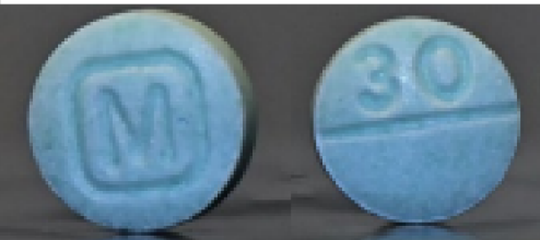
Oxycodona M30 falsificada