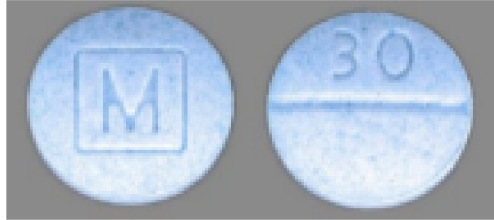
Oxycodona M30 auténtica