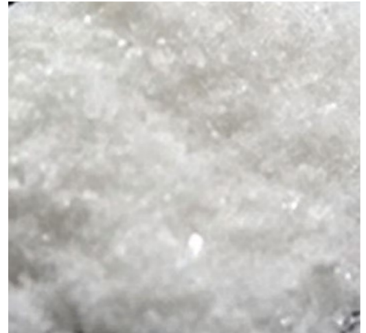
Metanfetamina de cristal en polvo