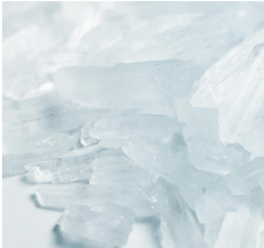
Metanfetamina de crista